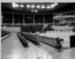
Pasivaikščiujame po pagalbines patalpas, persirengimu kambarius.